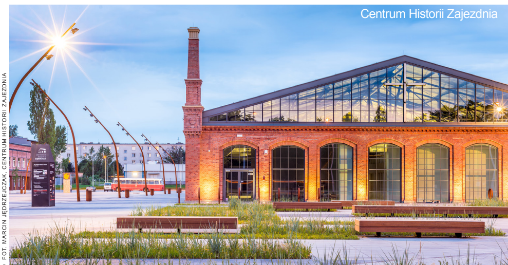
Centrum Historii Zajezdni

To tylko kilka z kilkuset przykładów wykorzystania w naszym kraju środków z Funduszy norweskich i EOG na obszar kultury. Na tym jednak nie koniec. Przedstawiciele władz Polski, Norwegii, Islandii i Liechtensteinu w grudniu 2017 roku podpisali umowę określającą kolejną kwotę, jaką do roku 2021 otrzyma nasz kraj – 809 mln euro. Aż 75 mln euro z tej puli będzie wspierał rozwój kultury i odnowę dziedzictwa w Polsce.